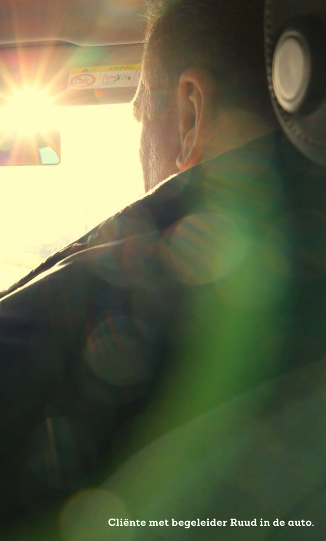
Cliënte met begeleider Ruud in de auto.

hun alles overheersende angst af te helpen en ze weer van het leven te laten genieten.